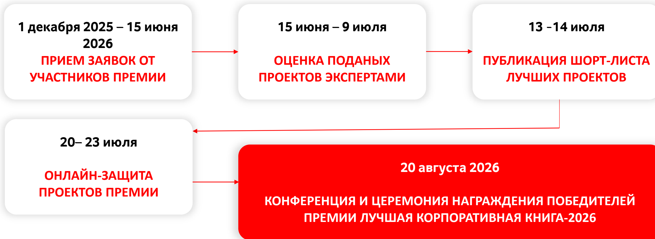
График работы премии «Лучшая корпоративная книга-2026»*

* В графике работы премии возможны уточнения.